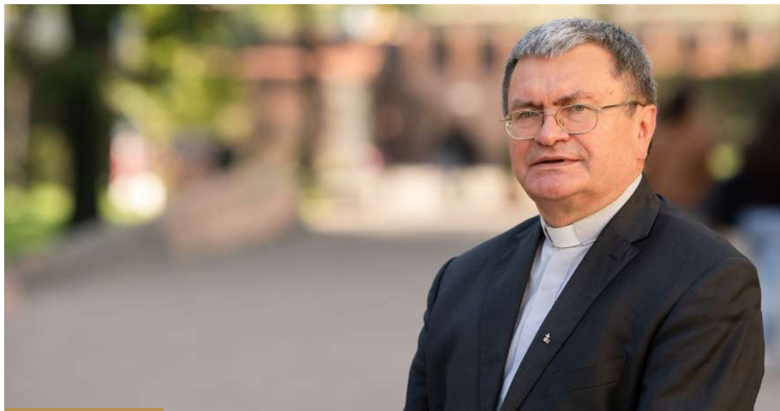
W dorobku badawczym Jubilata znajduje się m.in. 12 monografii autorskich; 9 monografii zbiorowych; ponad 100 opracowań naukowych z zakresu filozofii, kognitywistyki, kulturoznawstwa, ekologii, historii sztuki, bibliistyki i teologii; fot. Piotr Szałański

naukowych, również w języku angielskim i niemieckim, które ukazały się w polskich i zagranicznych, także prestiżowych wydawnictwach. W jego dorobku badawczym znajduje się m.in. 12 monografii autorskich; 9 monografii zbiorowych; ponad 100 opracowań naukowych z zakresu filozofii, kognitywistyki, kulturoznawstwa, ekologii, historii sztuki, bibliistyki i teologii. Opublikował też kilkadziesiąt książek, artykułów, tłumaczeń popularyzujących wiedzę z zakresu teologii, bibliistyki i duchowości.