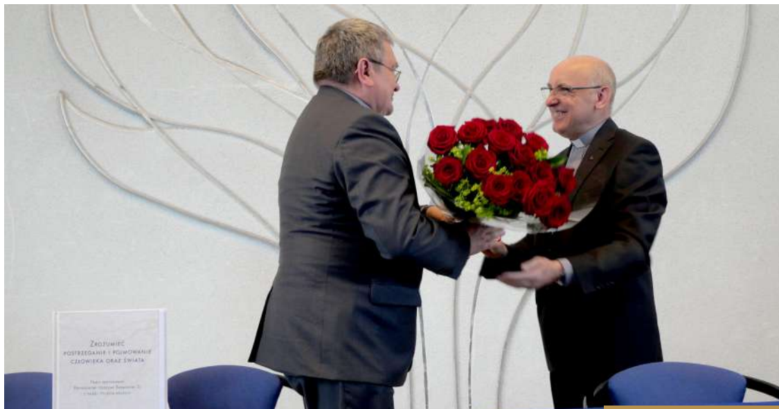
Wręczenie Księgi Jubileuszowej

wszystkim Rektora Akademii Ignatianum w Krakowie w latach 2014–2022. Przez 7 lat był etatowym pracownikiem Wydziału Filozoficznego Uniwersytetu Jagiellońskiego, gdzie pełnił funkcję kierownika Zakładu Kognitywistyki i zasłużył się, współtworząc kierunek kognitywistyka. W latach 2011–2014 i 2015–2018 był członkiem Komitetu Nauk Filozoficznych przy Wydziale I Nauk Humanistycznych Społecznych Polskiej Akademii Nauk. Jest profesorem honorowym Uniwersytetu im. Iwana Franki w Żytomierzu, Politechniki Śląskiej oraz konsultorem Rady Naukowej Konferencji Episkopatu Polski.