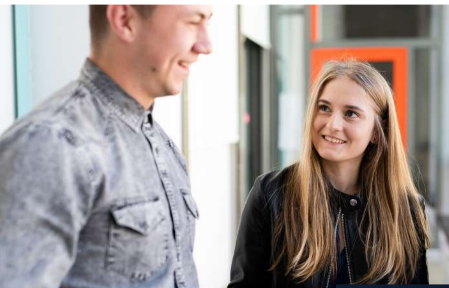
Partnerstwo z Avant Assessment to ważny krok ku umocnieniu pozycji uczelni na międzynarodowym rynku edukacyjnym

CEFR jest również wykorzystywany jako punkt odniesienia przy opracowywaniu narzędzi do