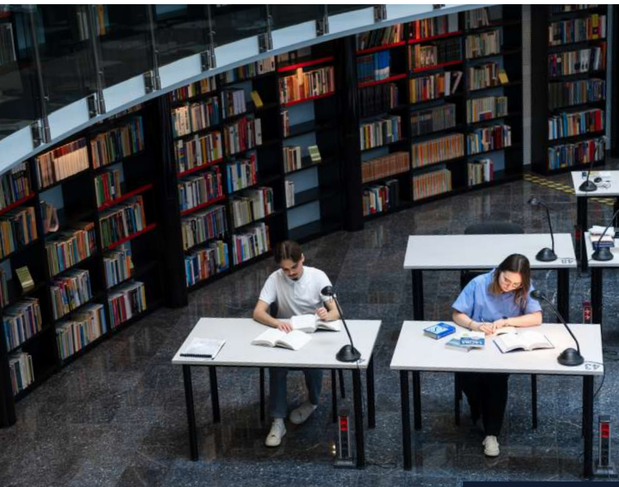
„Potencjał naukowy Uczelni cieszy się naprawdę wysokim uznaniem środowiska naukowego”

To jest osiągnięcie całej Wspólnoty Akademickiej, która pracowała i nieustannie okazuje zaangażowanie, by uzyskane uprawnienia utrzymać, podnosić i poszerzać. Pragnę raz jeszcze podkreślić, że potencjał naukowy Uczelni cieszy się naprawdę wysokim uznaniem środowiska naukowego. Żadna uczelnia nie otrzymuje bez podstaw takich kategorii jak „A” i „B+” i jest to bez wątplenia powód do dumy. Jest to plon pracy, woli oraz ogromnego potencjału i zaangażowania.