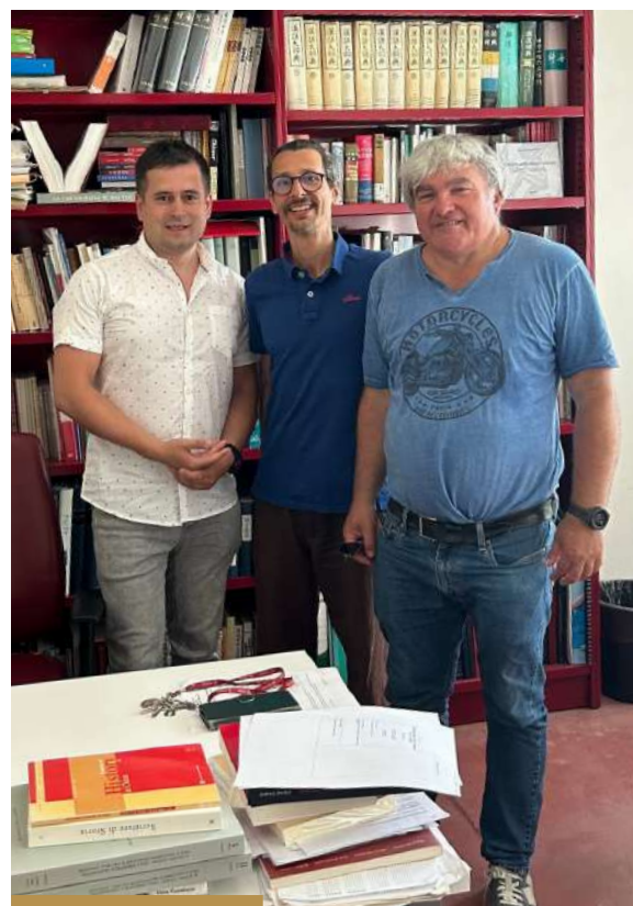
Celem projektu jest wydanie obszernego dzieła „Historia Sinarum”