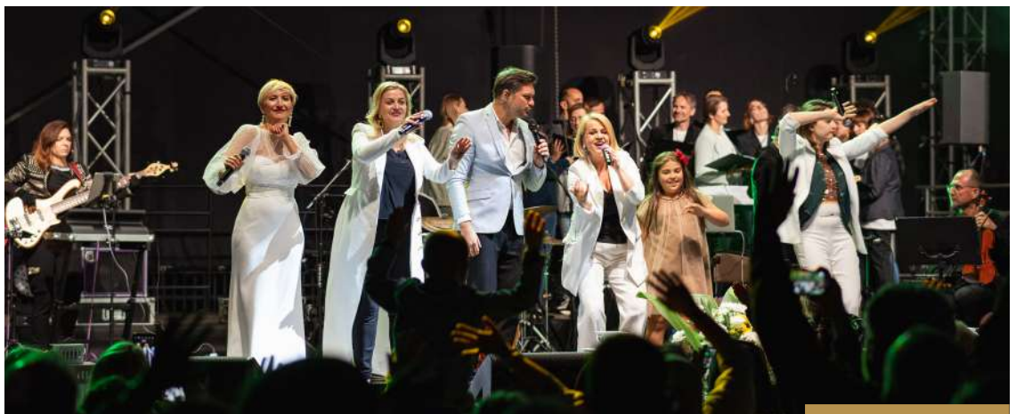
Artyści podczas sobotniego koncertu uwielbienia; fot. Hubert Rydz.

Na koniec chciałbym przypomnieć słowa jednej z naszych absolwentek, która wielokrotnie powtarzała, że dobro zawsze wraca, tak więc nie miejmy oporów i działajmy wspólnie dla dobra innych.