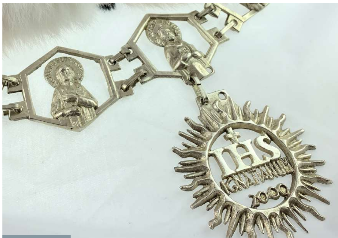
Insignia władzy rektorskiej

Mądrość brzmi w Ojca Słowie Odwiecznym Można dostrzec ją w pięknie stworzenia Mówi do nas przez głos wykluczonych I prowadzi do głębi istnienia