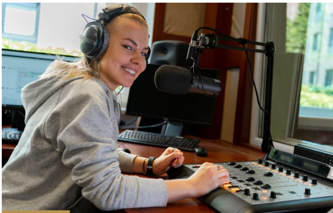
Stacja 4 funkcjonuje od kwietnia 2023 r.; fot. Studio_Niepoprawne