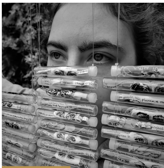
Akcja artystyczno-społeczna „#dziękujza”; fot. Aneta Fausek-Kaczanowska

Zachęcamy do przeczytania artykułu „Czy sztuka partycypacyjna może zaistnieć w Internecie?”, w którym akcja została szerzej opisana: Plum Print visual indicator of research metrics (inawjournal.pl).