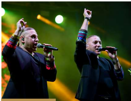
Zespół Golec uOrkiestra na scenie