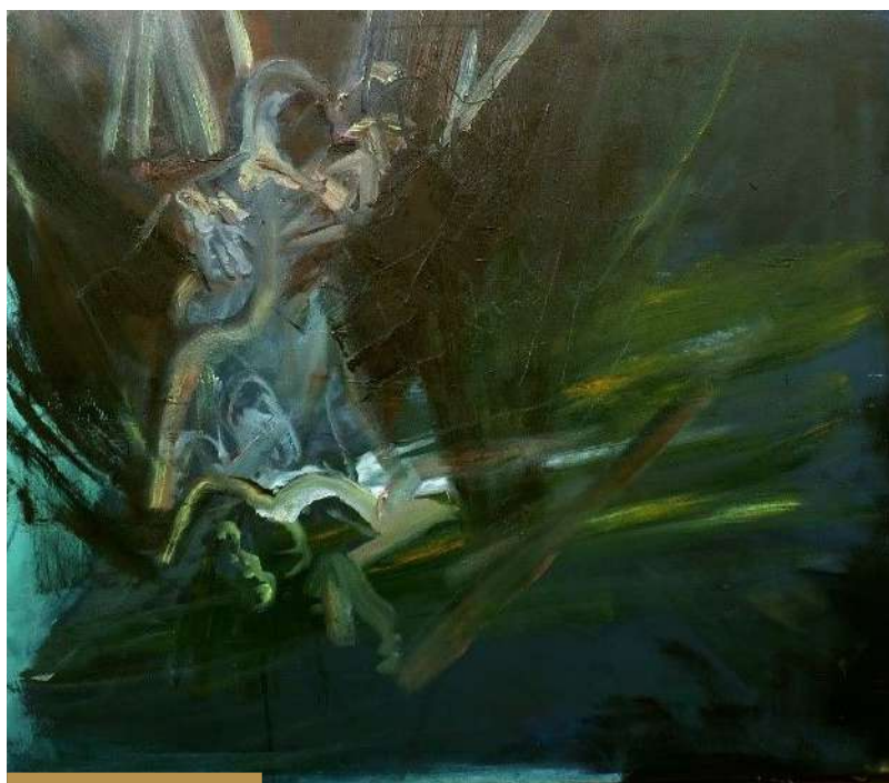
Natalia Szewczyk, Przebaczenie, 130x150, olej na płótnie, 2023