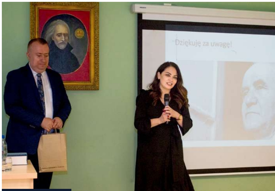
CKiD realizuje swoją misję poprzez: organizowanie publicznych debat, seminariów, sympozjów i konferencji naukowych, działalność publicystyczną i wydawniczą; fot. Archiwum Centrum Kultury i Dialogu AIK

Zachęcamy także do obserwowania strony CKiD na Facebooku.